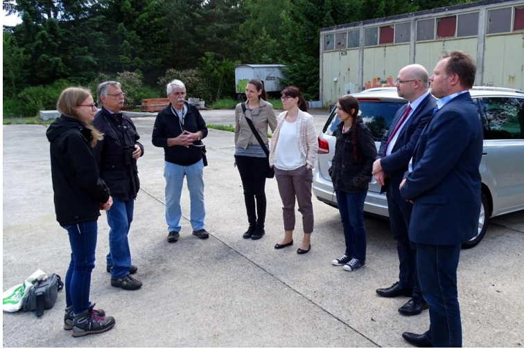
Foto: Treffen am SOLARPARK zur Scheckübergabe an den NABU-Waldsolms sowie zum Interview / Filmaufnahmen mit den Mitarbeiterinnen vom DG VERLAG aus Wiesbaden.